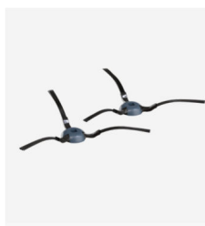
2 kartáče pro úklid podél stěn a koutů