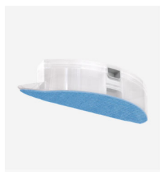
Nádobka na vodu pro režim vytírání + 2 utěrky z mikrovlákna